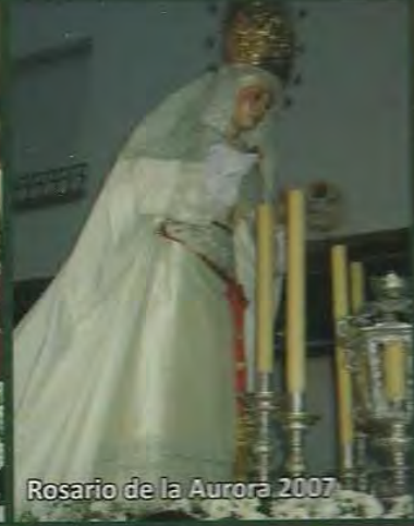
Rosario de la Aurora 2007