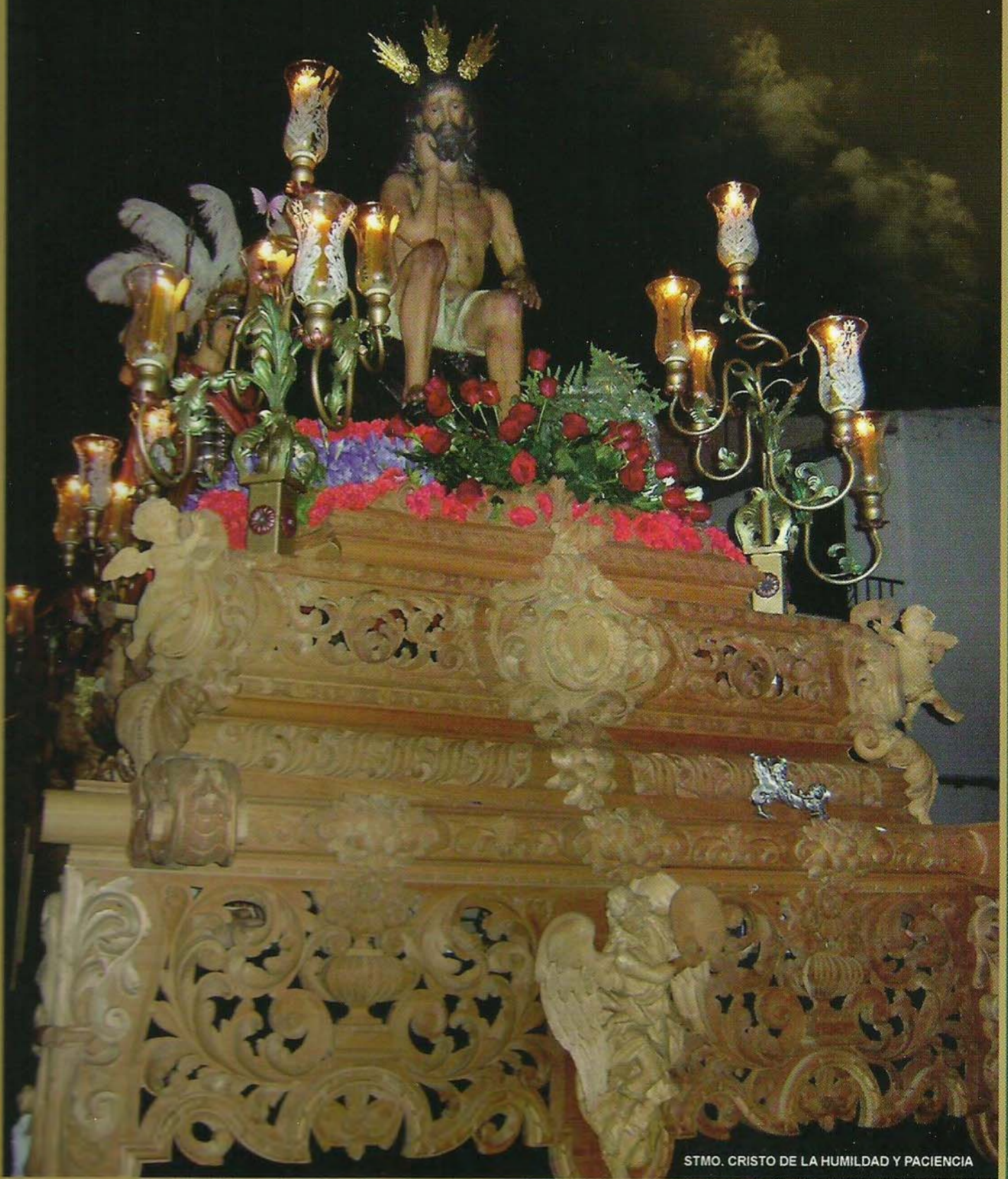
STMO. CRISTO DE LA HUMILDAD Y PACIENCIA