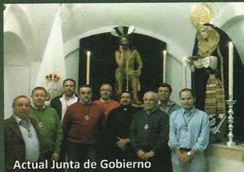
Actual Junta de Gobierno