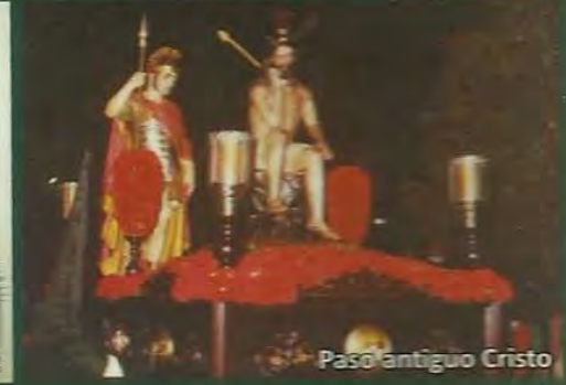
Paso antiguo Cristo