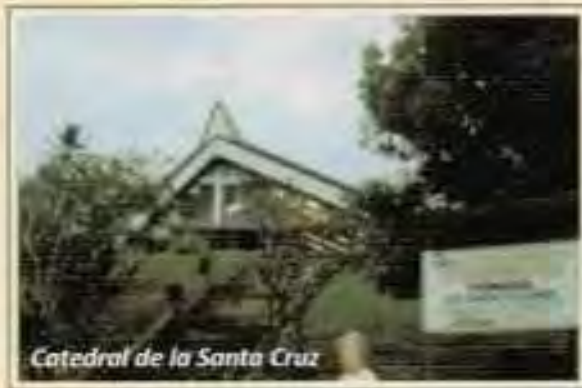
Catedral de la Santa Cruz

1983 y ascendido arzobispo de la misma diócesis metropolitana el 24 de abril de 1984