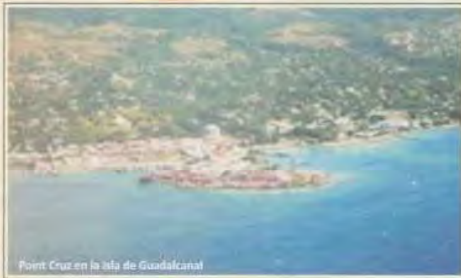
Point Cruz en la isla de Guadalcanal

El día 7 de abril de 1568 zarpó Don Pedro Ortega Valencia, con un bergantín 30 hombres y el piloto Hernán Gallego descubriendo las islas de Ramos. La Galera, Buenavista, San Dimas, Flores y Guadalcanal, donde se colocó una Gran Cruz y se celebró la primera misa en el lugar hoy conocido como Point Cruz.