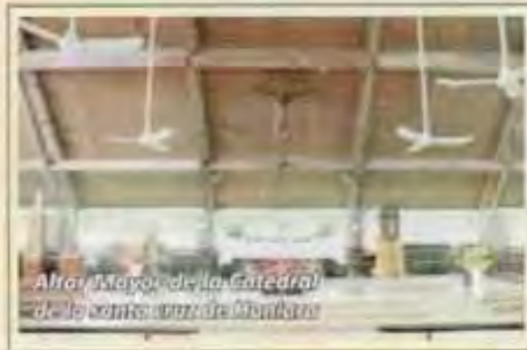
Altar Mayor de la Catedral de la Santa Cruz de Honiara

Estuvo en nuestro pueblo y quedo gratamente impresionado. Le conocí en Sidney, viajó con la juventud que participó en la JMJ y tienen intención de venir a Madrid a la JMJ en agosto del 2011.