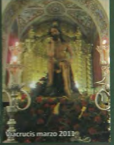
Viacrucis marzo 2011