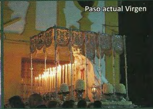
Paso actual Virgen