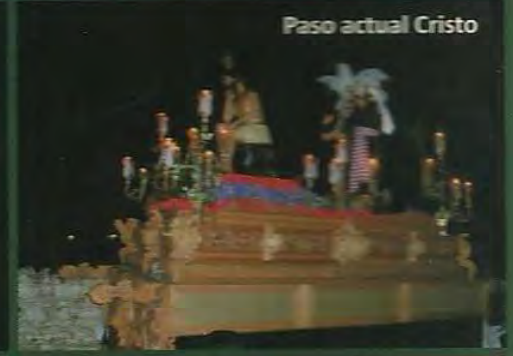
Paso actual Cristo