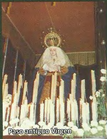
Paso antiguo Virgen