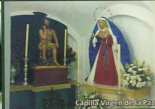
Capilla Virgen de la Paz