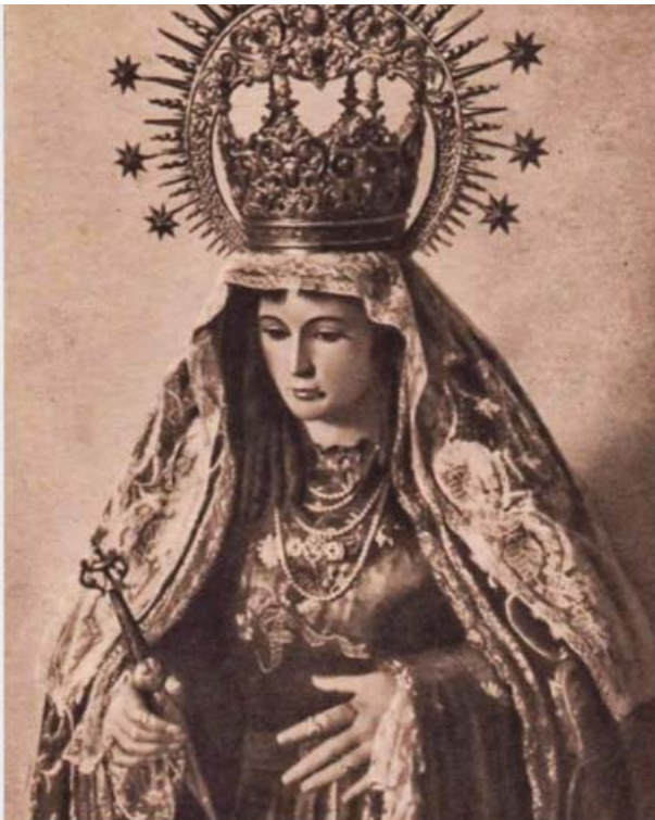
Hermandad De La Amargura Constantina 18 h · 🌐

Este fin de semana, la Hermandad de Guaditoca hubiera celebrado en la sevillana localidad de Guadalcanal la romería en honor a su patrona. En esta Hermandad de San Gonzalo tenemos muy presentes a estos cofrades que estuvieron junto a nosotros en los memorables momentos de la coronación canónica de Nuestra Señora de la Salud, adhiriéndose a la misma.