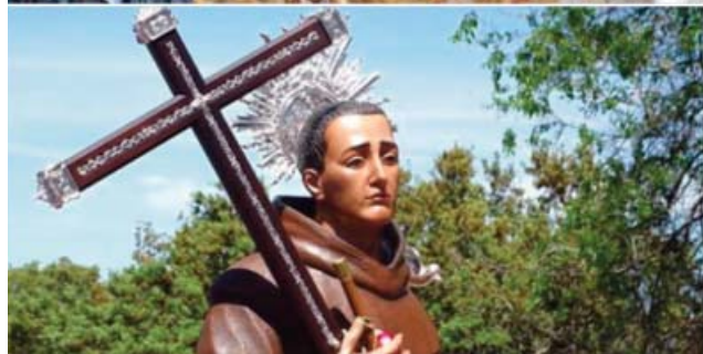
Hdad. San Diego de San Nicolas del Puerto Ayer a las 11:21 · 🌐

El mes de Abril significa para nuestros vecinos de Guadalcanal más que un mes, significa "camino", "Romería", significa la traída de su madre, la Virgen de Guaditoca, a su pueblo. Hoy especialmente queremos enviar a la Hermandad de Guaditoca de Guadalcanal y a los devotos de la Virgen nuestro cariño más sincero. La pandemia del Coronavirus se está llevando por delante nuestras celebraciones más queridas, que en estos meses de primavera salpican el calendario de nuestra sierra. Aprovechemos para pedir una oración por las personas fallecidas por el Covid-19. Que sean todos acogidos bajo el manto protector de Ntra. Sra. de Guaditoca y de nuestro Patrón San Diego.