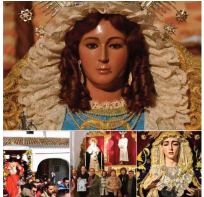
Hermandad de San Gonzalo 1 h · 🌐

Es mucha la devoción que despierta Ntra. Sra. de Guaditoca, incluso más allá de Guadalcanal. A ello se unen los lazos eternos con otras hermandades y corporaciones más allá de nuestro término municipal. Por eso, en un día especialmente triste por no haber podido celebrar esta romería de abril, han sido varias las hermandades que han querido mostrar su apoyo. Así, han trasladado su apoyo mediante sus páginas de facebook las hermandades de La Amargura, de Constantina, la de San Diego, de San Nicolás del Puerto y también la sevillana de San Gonzalo.