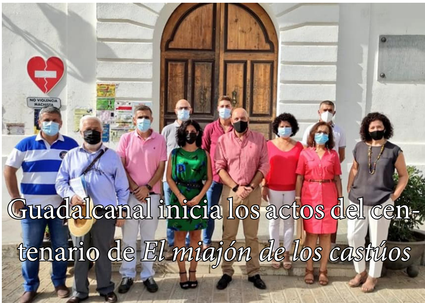
Guadalcanal inicia los actos del centenario de El miajón de los castúos