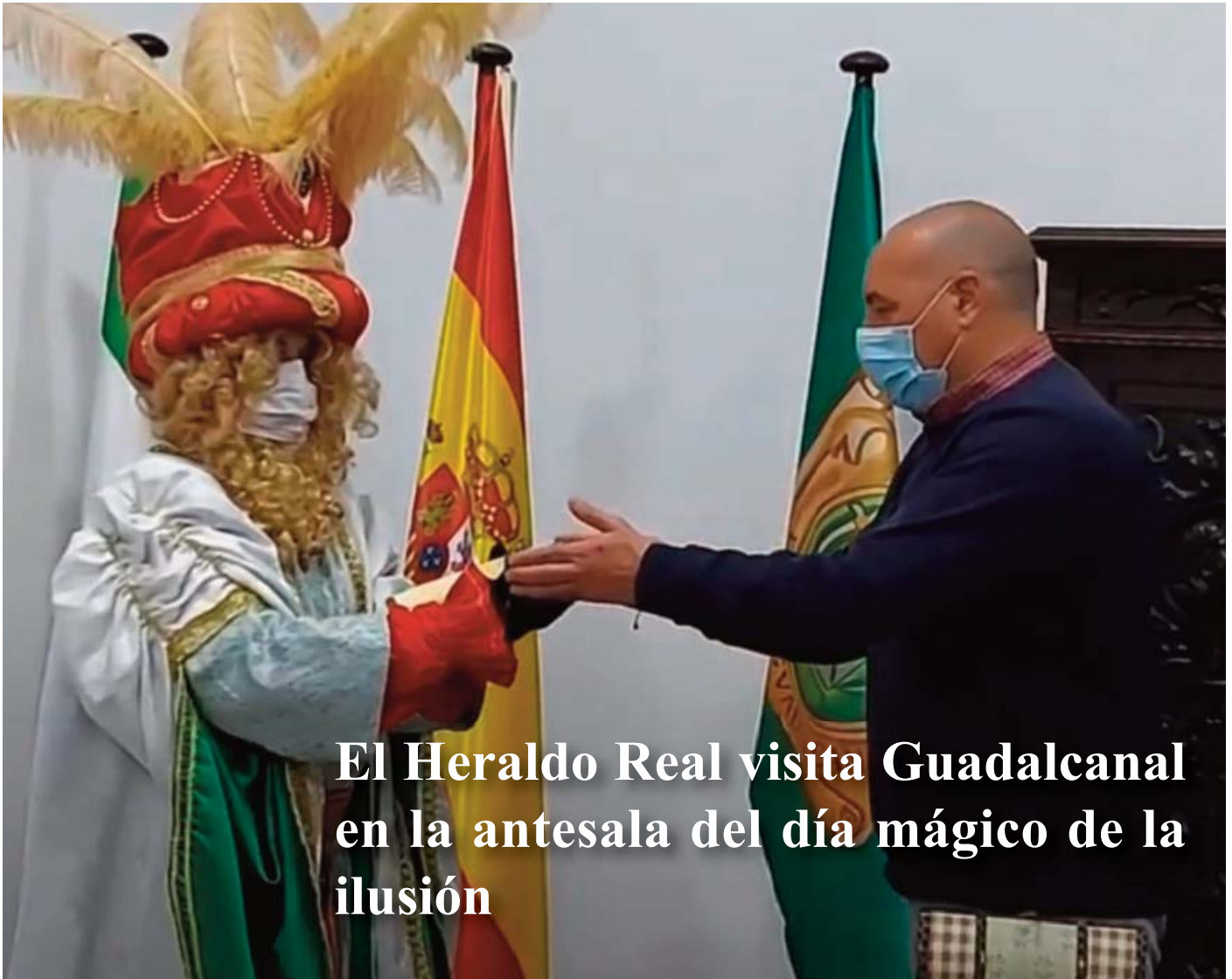
El Heraldo Real visita Guadalcanal en la antesala del día mágico de la ilusión