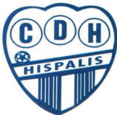
Escudo del Híspalis

No hay que olvidar que enfrente hay un equipo que tan solo ha sido derrotado en dos partidos. Un equipo que tiene todas las papeletas de clasificar para cuartos y que, a buen seguro, no vendrá a Guadalcanal de paseo. Con respeto, sin miedo, pero con mucho ojo, que es el Híspalis.