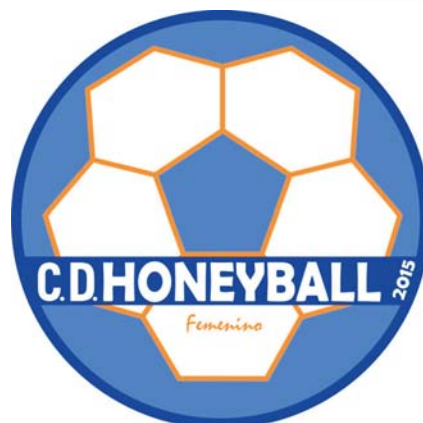
Escudo del Honeyball

Con estos precedentes ha lugar a la esperanza. Siempre con respeto, nunca con miedo.