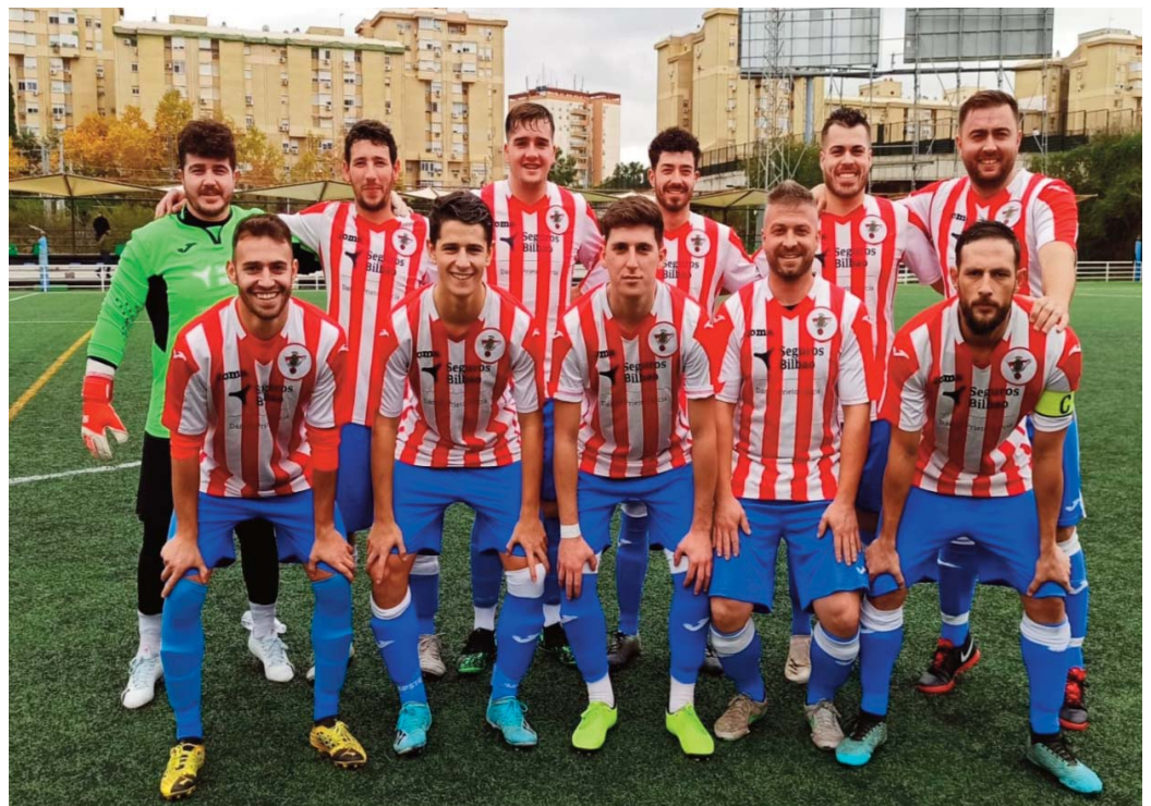
Once inicial del Guadalcanal ante el Calavera

El Calavera estaba predestinado a ganar este partido y tal vez por eso, cuando iba ganando uno a cero y el Guadalcanal empató hasta en dos ocasiones, romper la burbuja era tan doloroso que se anulaban los dos goles. La desfachatez hizo que en uno de ellos incluso se dispusiera el balón para sacar de centro cuando el juez de línea, cediendo a las presiones locales instó a que