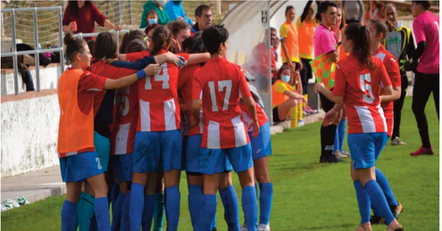
La jugadoras del Guadalcanal CD celebran el 3 a 1