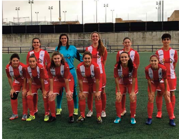
Once del Guadalcanal Femenino ante el Híspalis

embargo la fortuna de acertar en el desconcierto guadalcanalense tras la señalización de un penalti a favor y la posterior anulación de esa decisión de